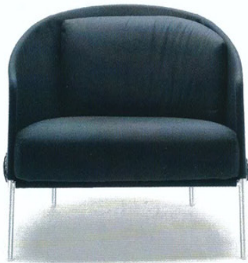
Fauteuil | Armchair Poncho LIVING DIVANI