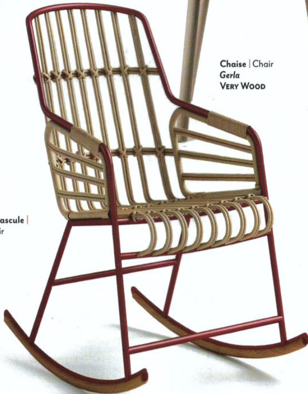
Fauteuil à bascule | Rocking chair Raphia CASAMANIA