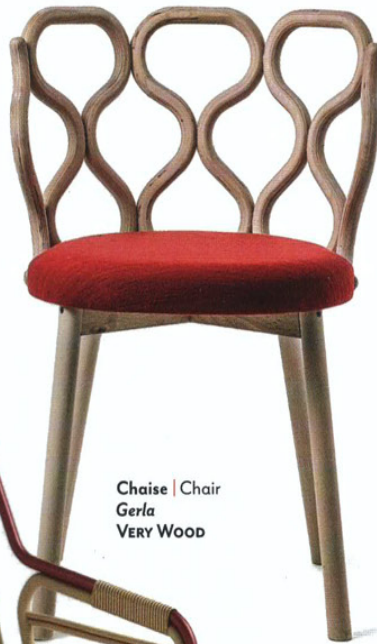
Chaise | Chair Gerla VERY WOOD