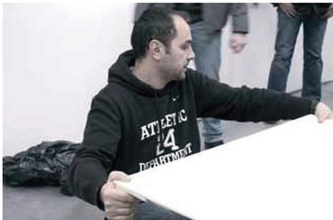
设计师制作测试水泥桌模型