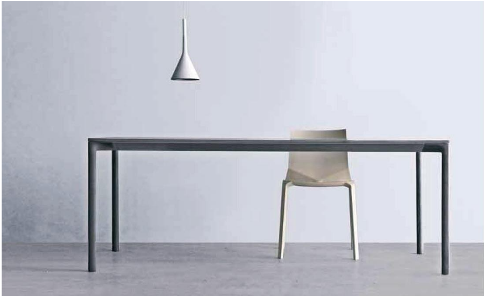
保罗&卢卡 水泥作品集合